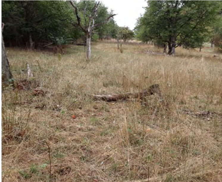
Abb.2 Fläche im Sommer 2022 nach Beweidung