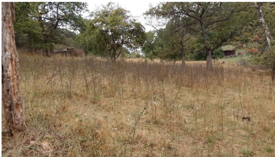
Abb.3 Fläche im Sommer 2022 nach Beweidung. Stockausschläge der Schlehe wurden anschließend mit Freischneider nachgemäht.